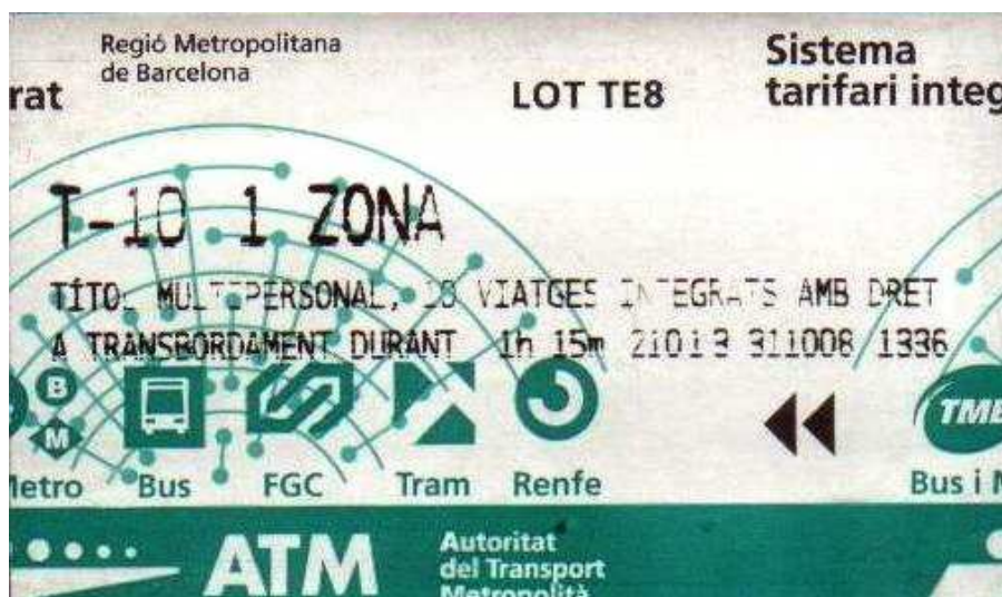
Die Karte des Anstoßes!

Endlich erbarmte sich einer dieser "Geschädigten", nahm mir das Ticket aus der Hand, steckte es in den Schlitz und ... es kam plötzlich hinten raus, das Drehkreuz bewegte sich und schon befand ich mich auf der anderen Seite. Auch bei Sonja funktionierte es wie von Zauberhand. Ich habe keine Ahnung, wie es dieser Mensch angestellt hat, aber bei unseren weiteren Versuchen klappte es auch. In der U-Bahn ergatterten wir dann einen Sitzplatz, darüber war ein Stationsplan angebracht und wir konnten bald erkennen, dass die Fahrt nach ein paar Minuten wieder zu Ende sein würde. Zu Fuß wäre es ein ordentlicher Marsch gewesen, aber mit der U-Bahn war das ein Klacks. An der Station "Sagrada Familia" stiegen wir zunächst aus und anschließend erwartungsvoll die Treppe hoch und sahen das: